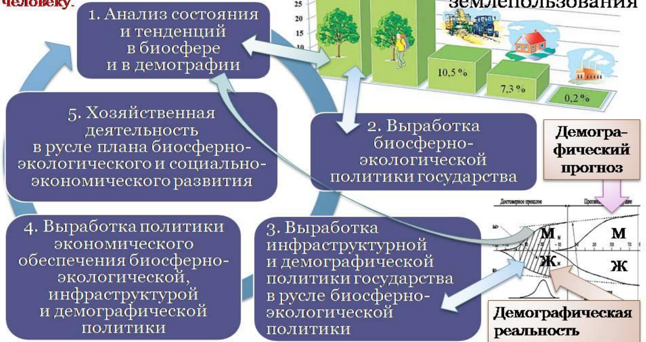
Рис. 1. Взаимная обусловленность частных управленческих задач в ходе реализации концепции устойчивого развития.

Деньги – «слуга», а не «господин» человеку.